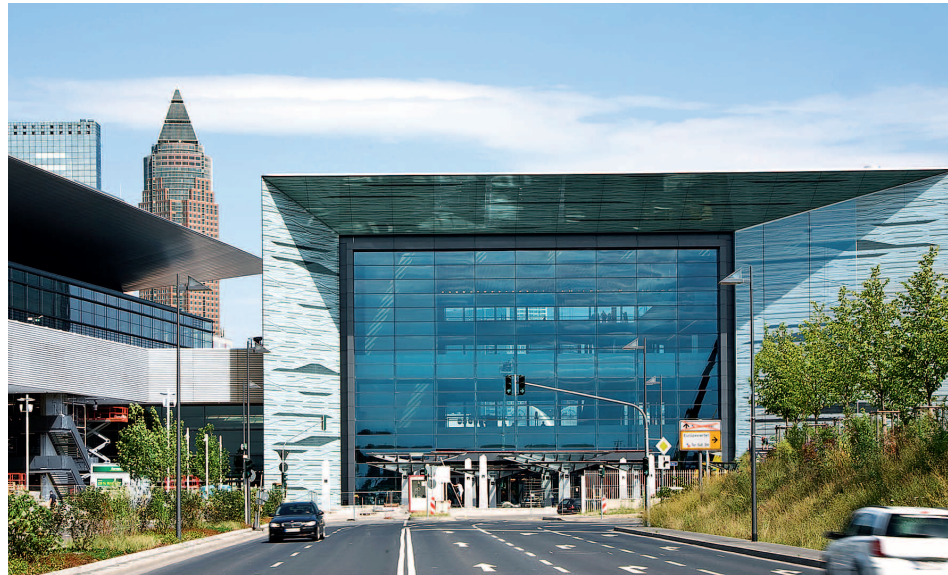
Die unmittelbare Nähe zu den Themen „Lack- und Karosserie-Bearbeitung“ in der neuen Halle 11 bietet insbesondere für den Bereich Schadensmanagement optimale Synergien.

„Trotz zahlreicher elektronischer und virtueller Kommunikationswege ist und bleibt das persönliche Gespräch eines der wichtigsten Mittel, um Geschäfte abzuschließen. Die Automechanika in Frankfurt ist deshalb für uns eine wichtige Brücke zum Markt. Unsere Besucher aus dem In- und Ausland nehmen sich Zeit für uns und unsere Produkte. Viele unserer internationalen Kooperationspartner sind darüber hinaus ebenfalls in Frankfurt als Aussteller vertreten, sodass wir ein Rundumpaket für alle Länder, Produkte und Dienstleistungen bieten können. Wir freuen uns mit einem ganz neuen Messestand auf internationale Kontakte und auf eine interessante Leitmesse für die weltweit aktive automotive Branche.“